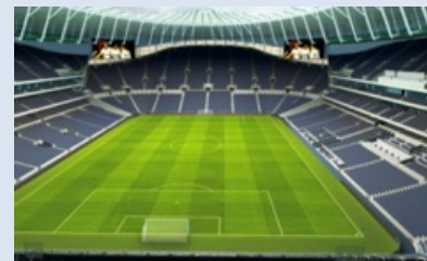
Vue depuis la Travel Club Lounge Half Way Line :